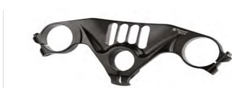
DUCATI PANIGALE V4 -V4S-V4R - cod. PSV4