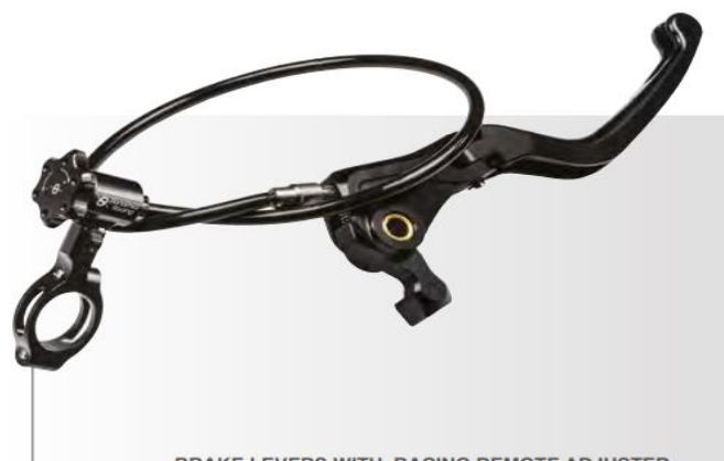
BRAKE LEVERS WITH RACING REMOTE ADJUSTER