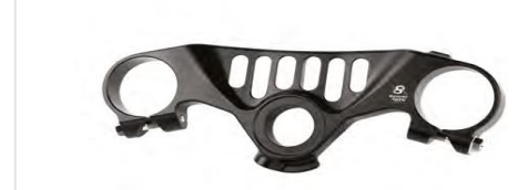
HONDA CBR1000RR-R FIREBLADE - cod. PSH2