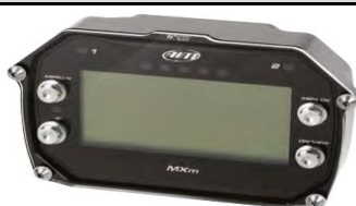
AIM MXm - cod. DCP17