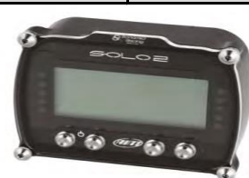
AIM Solo2 - cod. DCP18