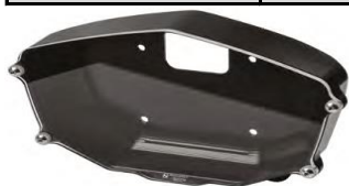
APRILIA RSV4 FACTORY / TUONO V4 (2021) - cod. DCP06