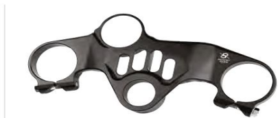
APRILIA RSV4 "STREET" - cod. PSA1